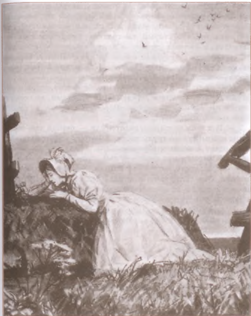
«Станционный смотритель». Художник Д. Шмаринов