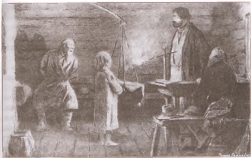
«Бирюк». Художник П. Соколов

утащить; в какую бы ни было пору, хоть в самую полночь, нагрянет, как снег на голову, и ты не думай сопротивляться, — силён, дескать, и ловок, как бес... И ничем его взять нельзя: ни вином, ни деньгами; ни на какую приманку не идёт. Уж не раз добрые люди его сжить со свету собирались, да нет — не даётся».