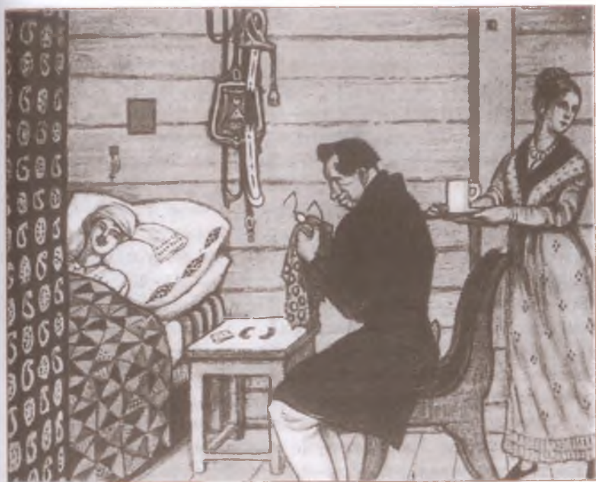
«Станционный смотритель». Художник М. Добужинский

Прошёл ещё день, и гусар совсем оправился. Он был чрезвычайно весел, без умолку шутил то с Дуней, то с смотрителем; насвистывал песни, разговаривал с проезжими, вписывал их подорожные в почтовую книгу, и так полюбился доброму смотрителю, что на третье утро жаль было ему расстаться с любезным своим постояльцем. День был воскресный; Дуня собиралась к обедне. Гусару подали кибитку. Он простился с смотрителем, щедро наградив его за постой и угощение; простился и с Дуней и вызвался довести её до церкви, которая находилась на краю деревни. Дуня стояла в недоумении... «Чего же ты боишься? — сказал ей отец, — ведь его высокоблагородие не волк и тебя не съест: прокатись-ка до церкви». Дуня села в кибитку подле гусара, слуга вскочил на облучок, ямщик свистнул, и лошади поскакали.