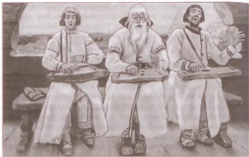
Гусляры. Художник В. Васнецов

стью действия, торжественностью тона. Былины возникли во времена, когда пение и рассказывание ещё не отошли друг от друга. Пение придавало рассказу торжественность.