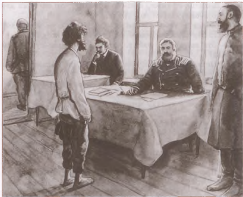
«Злоумышленник». Художник В. Пономарёв

ейного пути положил, ну, тогда, пожалуй, своротило бы поезд, а то... тьфу! гайка!