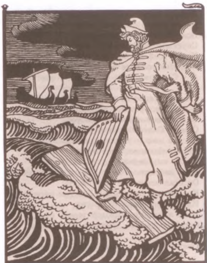
«Садко». Художник И. Архипов

Заснул на дощечке на дубовой. Проснулся Садко во синем море, Во синем море на самом дне, Сквозь воду увидел пекучись красное солнышко