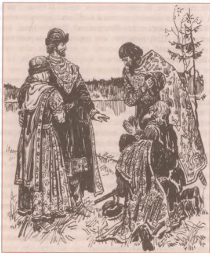
«Повесть о Петре и Февронии Муромских». Художник И. Пчелко

Так и сбылось. Встав утром, нашли, что те ветки стали большими деревьями.