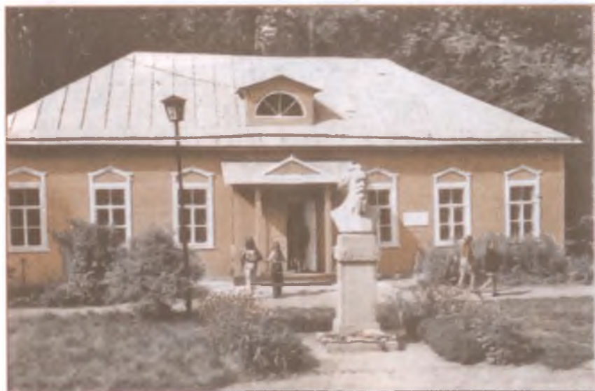
Музей А. К. Толстого. Село Красный Рог Почепского района Брянской области