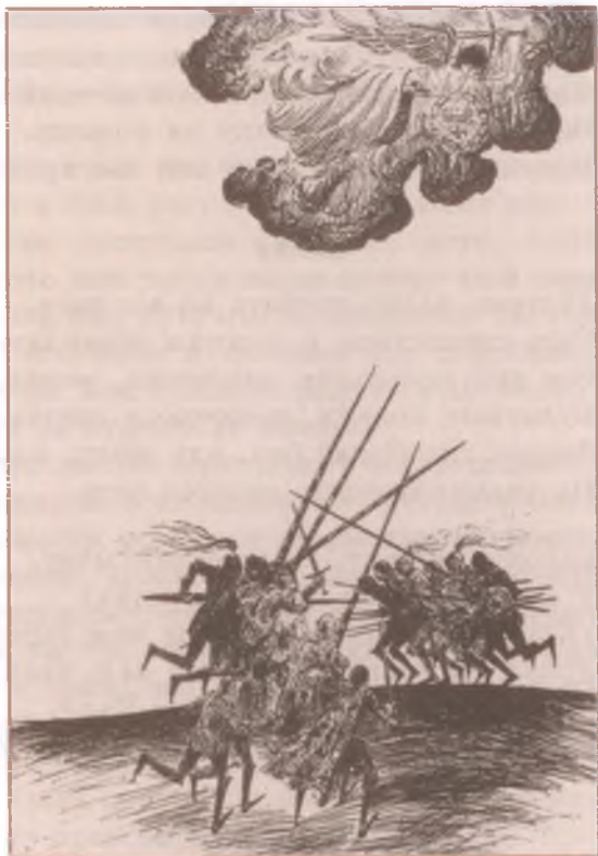
Иллюстрация к «Песни о Роланде». Художник Д. Бисти

Как королю послать о нас известье?» Ответил граф: «Не дам я вам совета. По мне, погибель лучше, чем бесчестье».