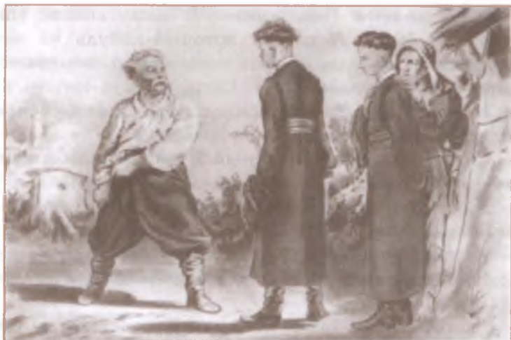
«Тарас Бульба». Художник П. Соколов

опустил? — говорил он, обращаясь к младшему, — что ж ты, собачий сын, не колотишь меня?