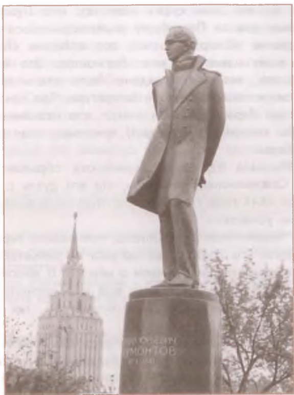
Памятник М. Ю. Лермонтову в Москве. Скульптор И. Бродский

Герой её — и «жертва», и «палач». Мысль о том, что зло порождает зло, он развил потом и в «Герое нашего времени».