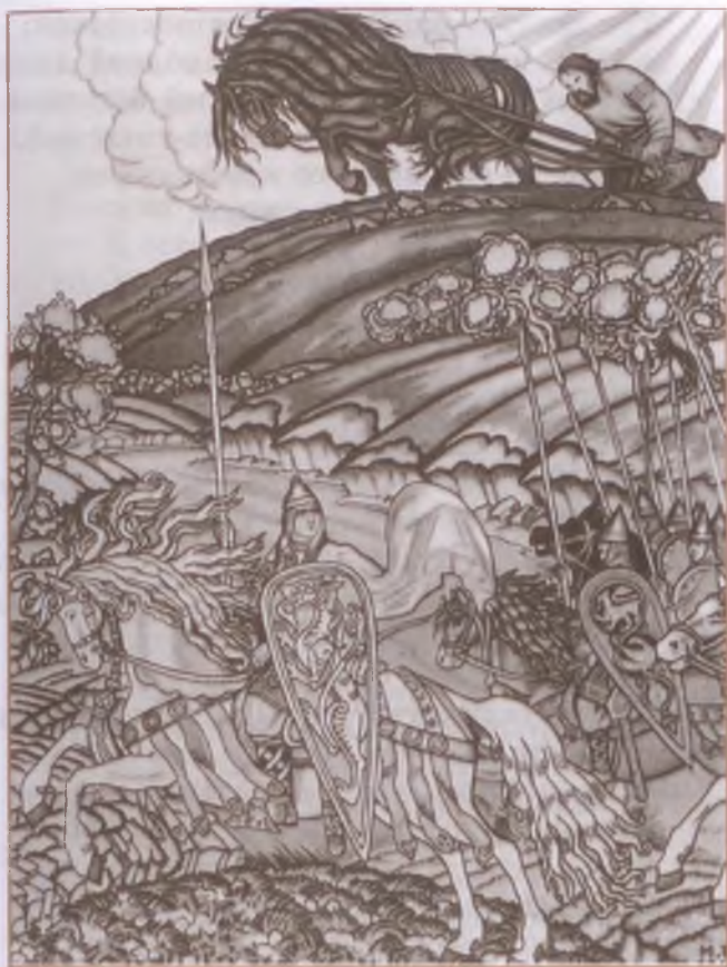
«Вольга и Микула Селянинович». Художник И. Билибин

Говорит-то Вольга таковы слова: — Божья помочь тебе, оратай-оратаюшко! Орать, да пахать, да крестьяновати, А бороздки тебе да помётывати, А пенья-коренья вывёртывати, А большие-то каменя в борозду валить!