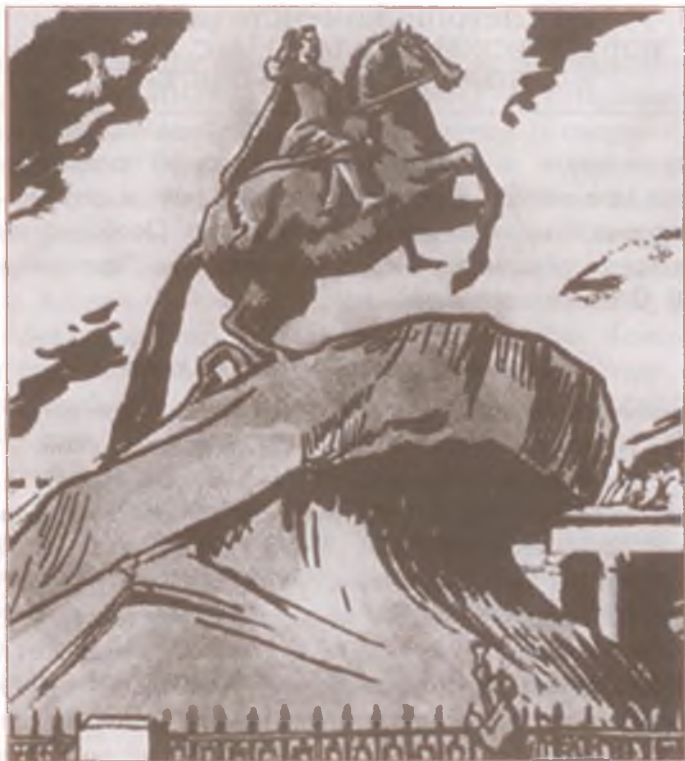
Медный всадник. Памятник Петру I в Санкт-Петербурге. Скульптор М. Фальконе