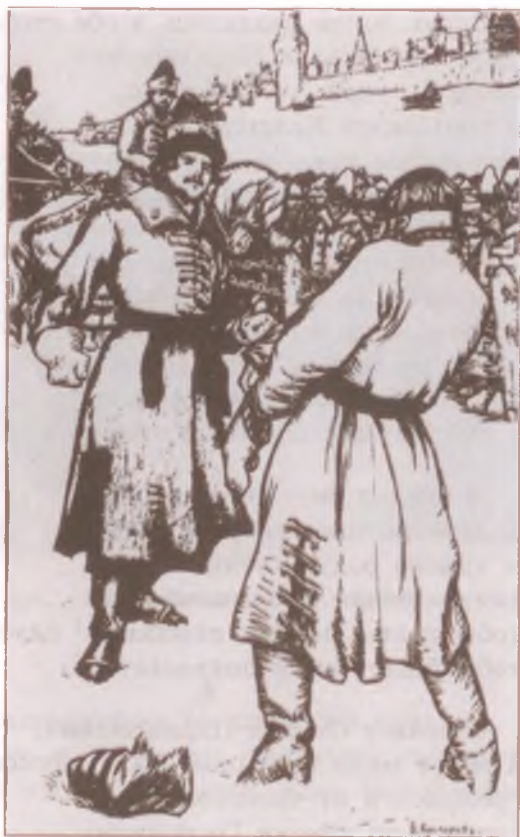
«Песня про... купца Калашникова». Художник И. Билибин