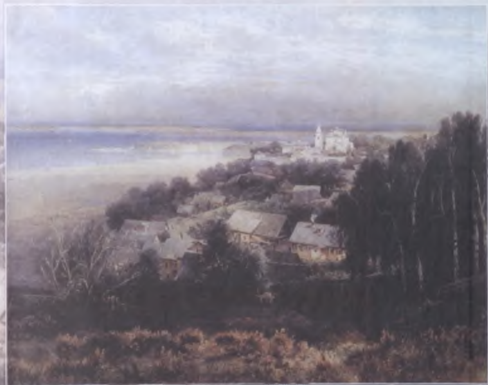
А. К. Саврасов, «Печёрский монастырь близ Нижнего Новгорода»