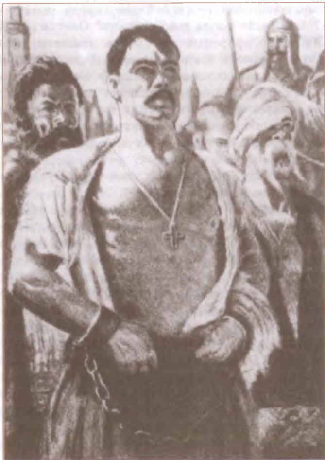
«Тарас Бульба». Художник Е. Кибрик

— Слышу! — раздалось среди всеобщей тишины, и весь миллион народа в одно время вздрогнул. Часть военных всадников бросилась заботливо рассматривать толпы народа... Но Тараса уже... не было: его и след простыл.