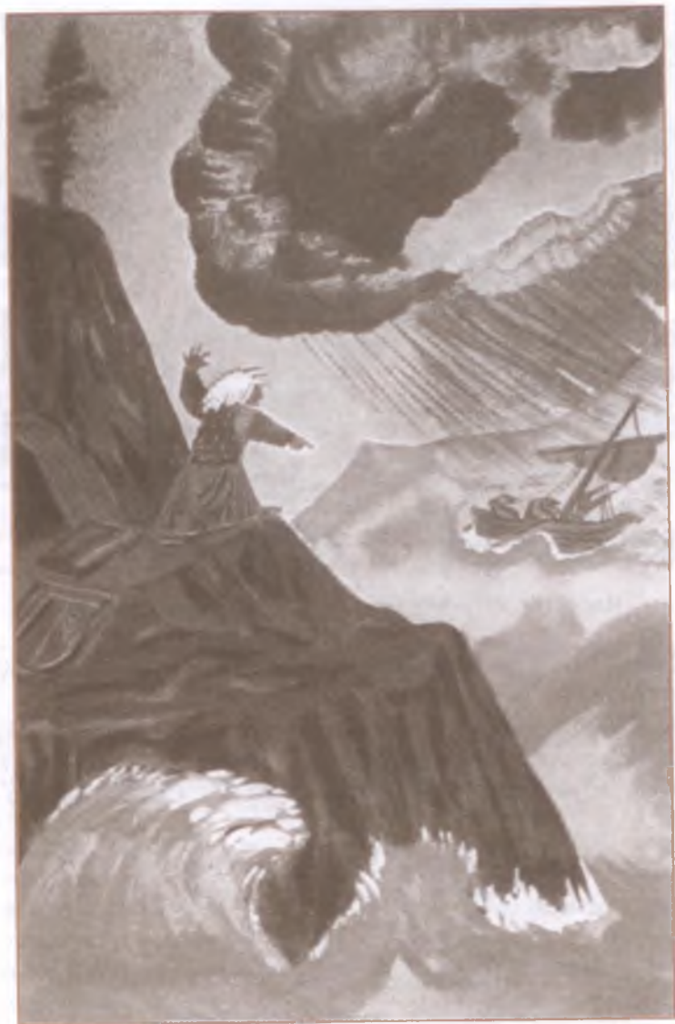
«Калевала». Похищение Сампо у Лоухи, хозяйки Похьёлы. Художник А. Порет

Выйдут пашни и посевы И различные растенья! Блеск луны отсюда выйдет, Благодетельный свет солнца