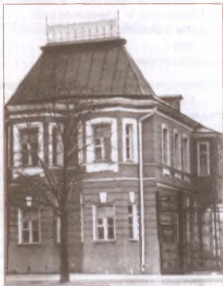
Дом-музей А. П. Чехова. Москва, ул. Садовая- Кудринская, д. 6