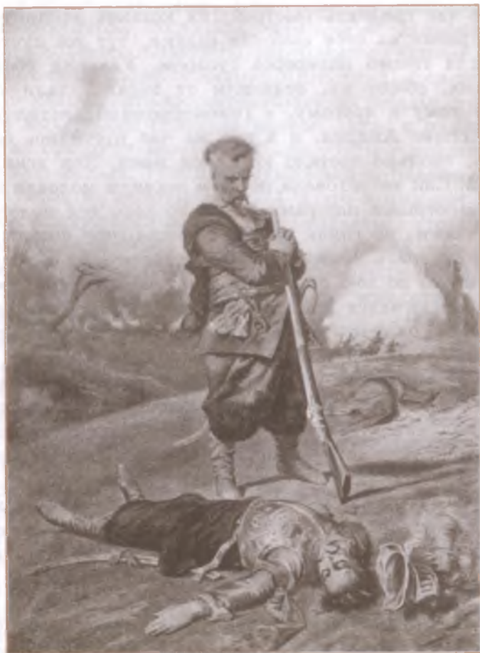
«Тарас Бульба». Художник П. Соколов

Как хлебный колос, подрезанный серпом, как молодой барашек, почуявший под сердцем смертельное железо, повис он головой и повалился на траву, не сказавши ни одного слова.