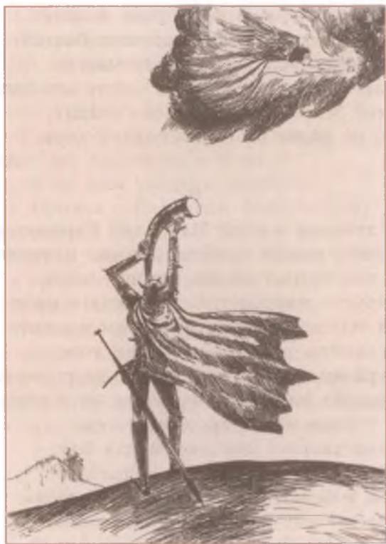
Иллюстрация к «Песни о Роланде».