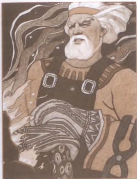
Иллюстрация к «Калевале». Художник Н. Кочергин

И мехи рабы качают, Сильно угли раздувают; Так три дня проводят летних И без отдыха три ночи; Наросли на пятках камни, Наросли комки на пальцах.