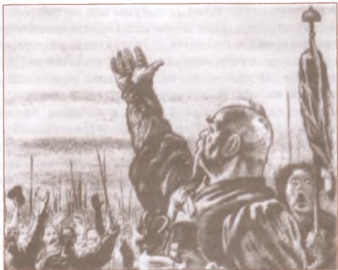
«Тарас Бульба». Художник Е. Кибрик

ные, и храмы, и князья, князья русского рода, свои князья. <...> Всё взяли бусурманы, всё пропало. Только остались мы, сирые, да, как вдовица после крепкого мужа, сирая так же, как и мы, земля наша! Вот в какое время подали мы, товарищи, руку на братство! Вот на чём стоит наше товарищество! Нет уз святее товарищества! Отец любит своё дитя, мать любит своё дитя, дитя любит отца и мать. Но это не то, братцы: любит и зверь своё дитя. Но породниться родством по душе, а не по крови, может один только человек. Бывали и в других землях товарищи, но таких, как в Русской земле, не было таких товарищей. Вам случалось не одному помногу пропадать на чужбине; видишь, и там люди! также Божий человек, и разговоришься с ним, как с своим; а как дойдёт до того, чтобы поведать сердечное слово, — видишь: нет, умные люди, да не те; такие же люди, да не те! Нет, братцы, так любить, как русская душа, — любить не то, чтобы умом или чем другим, а всем, чем дал Бог, что ни есть в тебе, а... — сказал Тарас и махнул рукой, и потряс седою головою, и усом моргнул, и сказал: — Нет, так любить никто не может! Знаю, подло завелось теперь на земле нашей; думают только, чтобы при них были хлеб-