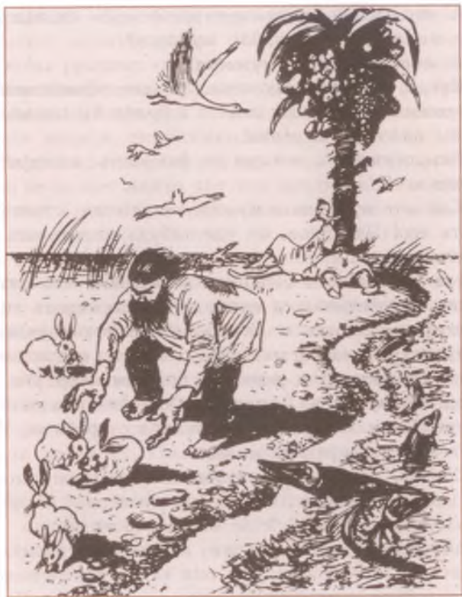
«Повесть о том, как один мужик двух генералов прокормил». Художник Н. Муратов

— Довольны, любезный друг, видим твоё усердие! — отвечали генералы.