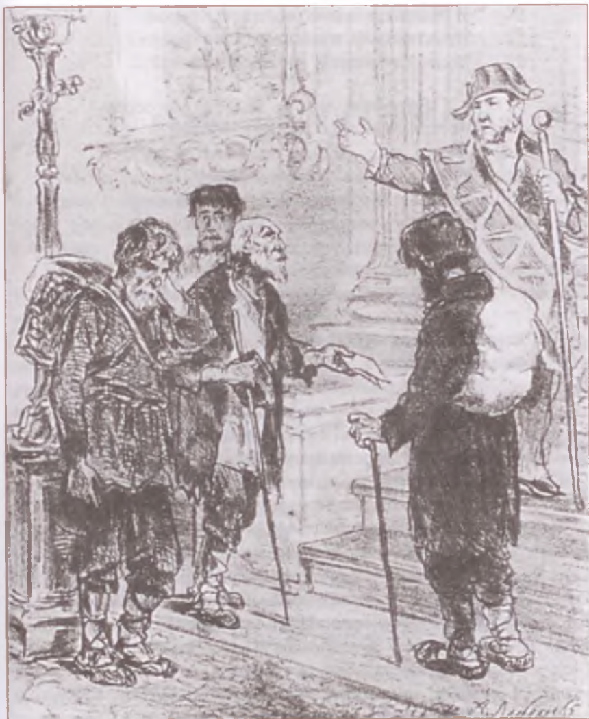
«Размышления у парадного подъезда». Художник А. Лебедев

Средиземной волны, — как дитя Ты уснёшь, окружён попечением Дорогой и любимой семьи (Ждущей смерти твоей с нетерпением); Привезут к нам останки твои, Чтоб почтить похоронную тризною,