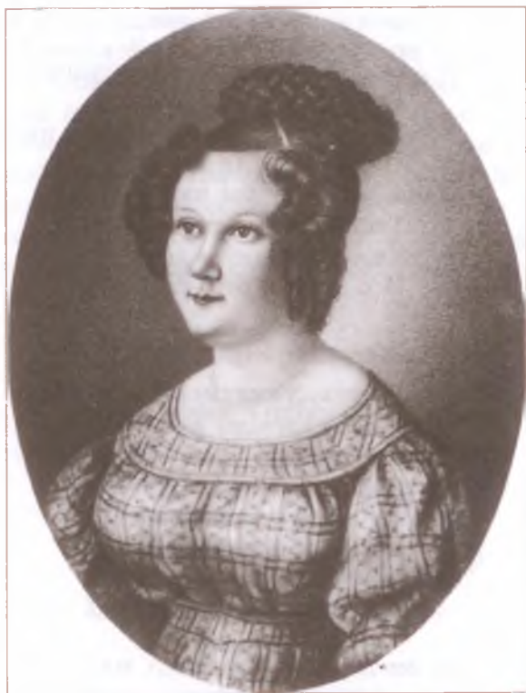
«Русские женщины». Княгиня Е. И. Трубецкая. Художник Н. Бестужев