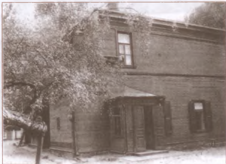
Музей Л. Н. Толстого. Москва, ул. Толстого, д. 21