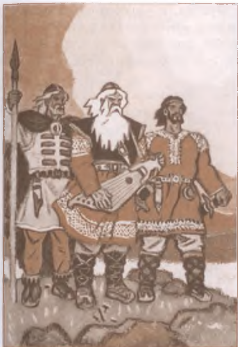
Иллюстрация к карело-финскому эпосу «Калевала».