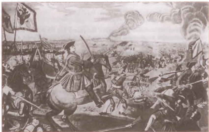
«Полтавская баталия». С мозаичной картины М. Ломоносова