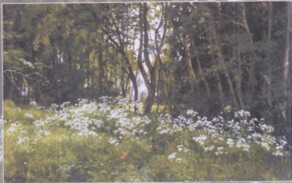
И. И. Шишкин. «Цветы на опушке»