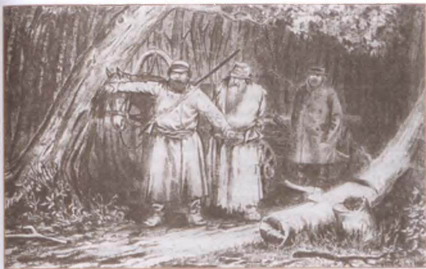
«Бирюк». Гравюра К. Вейермана с рисунка художника П. Коверзнева

Ей-богу, с голодухи... детки пищат, сам знаешь. Круто, во как, приходится.