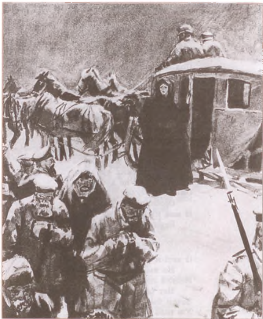
«Русские женщины». Встреча княгини Трубецкой с ссыльными. Художник Д. Шмаинов

Простите! да, я мучил вас, Но мучился и сам, Но строгий я имел приказ Преграды ставить вам! И разве их не ставил я? Я делал всё, что мог,