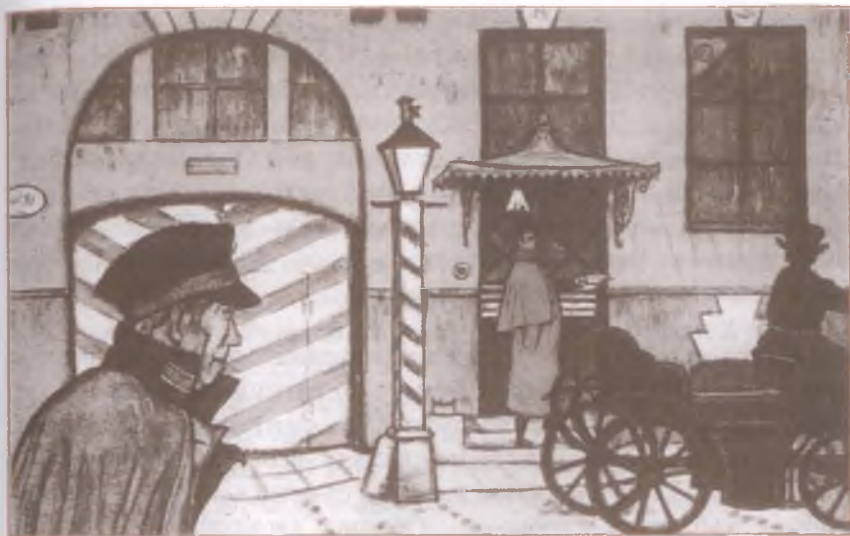
«Станционный смотритель». Художник М. Добужинский

отставного унтер-офицера, своего старого сослуживца, и начал свои поиски. Вскоре узнал он, что ротмистр Минский в Петербурге и живёт в Демутовом трактире 1 . Смотритель решился к нему явиться.