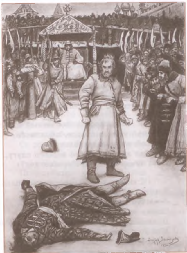
«Песня про... купца Калашникова». Художник И. Билибин

На груди его висел медный крест Со святыми мощами из Киева, И погнулся крест и вдавился в грудь; Как роса из-под него кровь закапала; И подумал Степан Парамонович: «Чему быть суждено, то и сбудется; Постою за правду до последнева!» Изловчился он, приготовился, Собрался со всею силою И ударил своего ненавистника Прямо в левый висок со всего плеча.