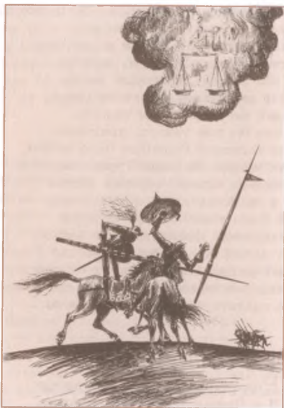
Иллюстрация к «Песни о Роланде». Художник Д. Бисти