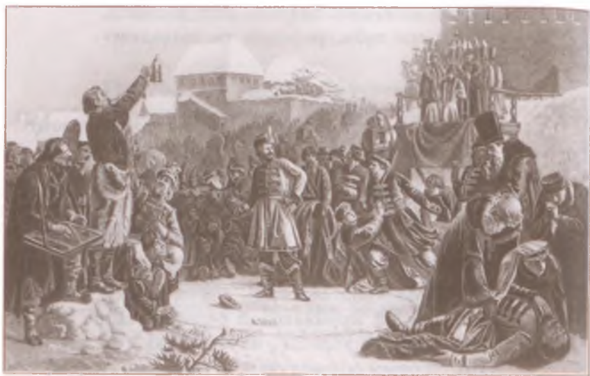
«Песня про... купца Калашникова». Художник И. Билибин

Выходите-ка во широкий круг; Кто побьёт кого, того царь наградит; А кто будет побит, тому Бог простит!»