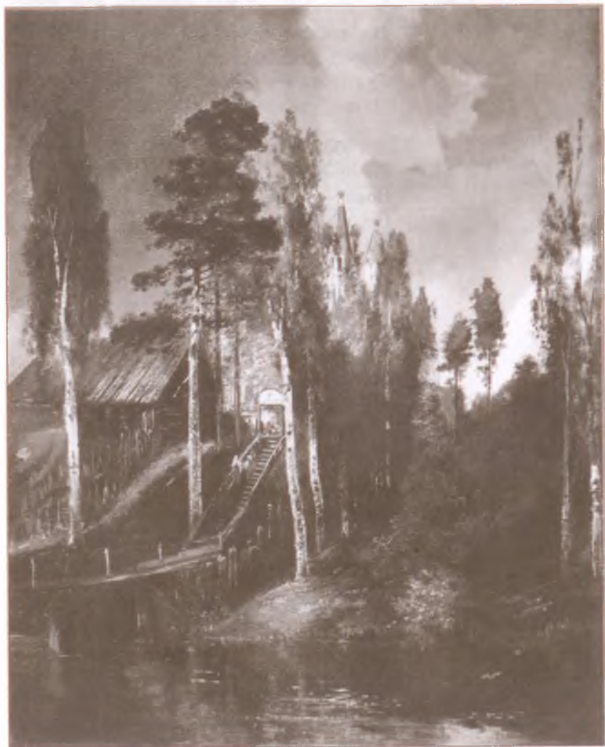
«У ворот монастыря». Художник А. Саврасов

Ещё дрожат цветы, полны водою И пылью золотой. О, не топчи их с новою враждою Презрительной пятой.