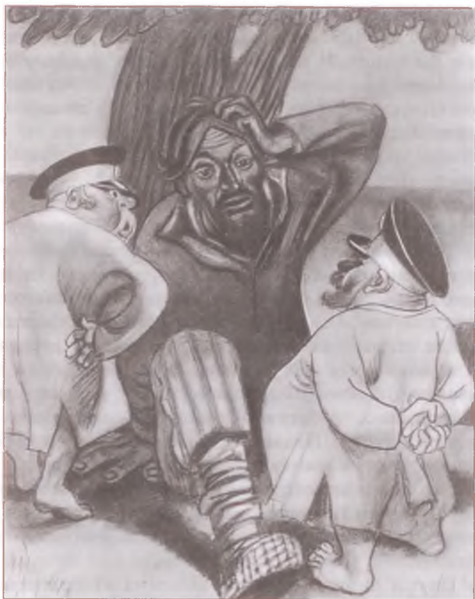
«Повесть о том, как один мужик двух генералов прокормил». Художник М. Черемных