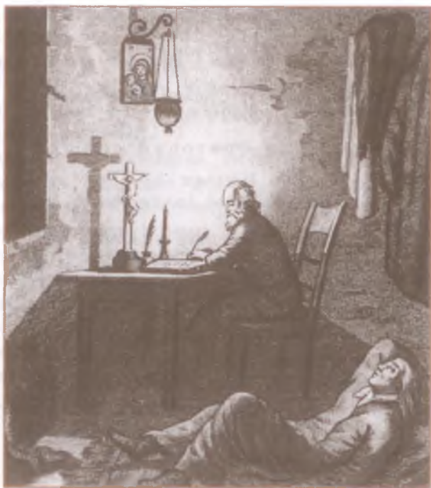
«Борис Годунов». Гравюра С. Галактионова