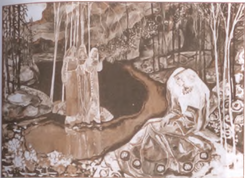
Иллюстрация к «Калевале». Художник Н. Кочергин

Сампо, по представлениям народа-крестьянина, — орудие мирного труда, оно даёт пищу и создаёт запас.