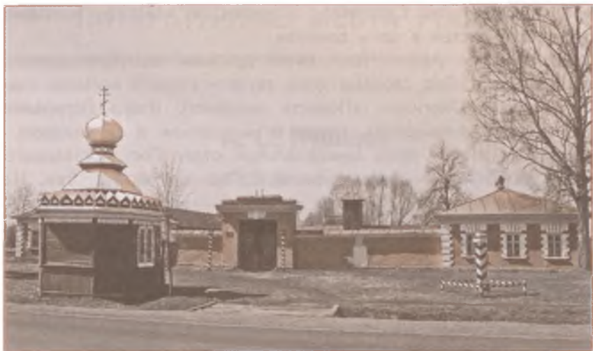
Дом станционного смотрителя, деревня Выра Гатчинского района Ленинградской области

рукоделия, интерьер начала XIX века. Значительную часть музейного комплекса занимает экспозиция «Русская почта XIX века».