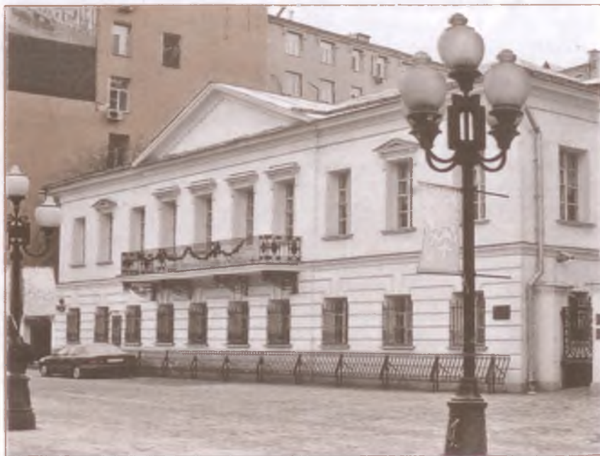
Московская квартира А. С. Пушкина на Арбате

23 января 1831 года А. С. Пушкин приезжает в Москву и снимает в центре, на Арбате, квартиру из пяти комнат. Прежде, приезжая в Москву, поэт останавливался у друзей или в гостиницах. Но теперь, накануне свадьбы, он решил обосноваться в древней столице более основательно. Сохранился документ, подтверждающий этот факт: «...нанял я, Пушкин, собственный г-на Хитрово дом... каменный двухэтажный с антресолями и к оному принадлежащими людскими службами...» В этот дом накануне свадьбы, 17 февраля, Пушкин пригласил друзей на мальчишник — прощание с холостой жизнью. Были поэты П. А. Вяземский, Е. А. Баратынский, Н. М. Языков, Д. В. Давыдов,