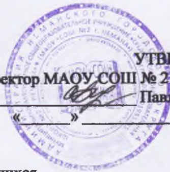
СХЕМА эвакуации персонала и учащихся МАОУ СОШ № 2 г. Немана при возникновении угрозы террористического акта